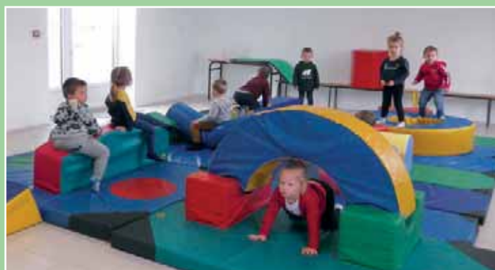
Depuis plusieurs semaines, nous disposons du matériel de gym prêté par l'UGSEL. Nous sommes ravis de pouvoir grimper, sauter, ramper, marcher en équilibre, faire des galipettes... Nous nous amusons beaucoup grâce aux différents parcours.