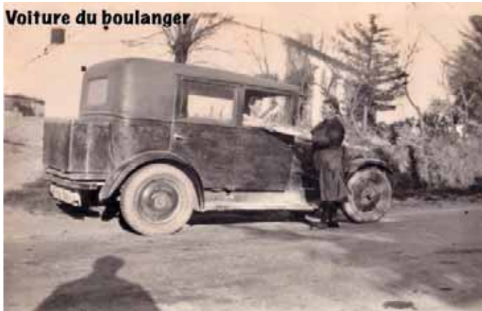
Voiture du boulanger