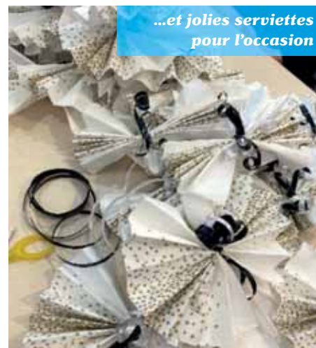
...et jolies serviettes pour l'occasion