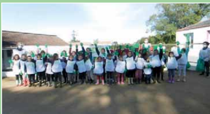
Les élèves de toute l'école ont participé à l'action « Nettoyons la nature »