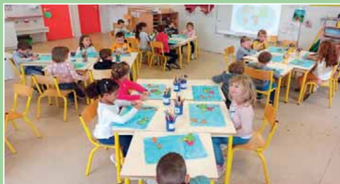
Dans la classe des MS GS en séance de découverte.