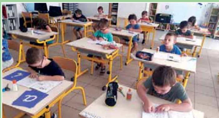
Les apprentis lecteurs de CP prennent plaisir à découvrir le monde de l'écrit en jouant avec les sons, les lettres et les mots au travers de diverses manipulations, de recherches dans les albums et de petits ateliers de théâtre !

Notre année sera plus particulièrement consacrée au respect de l'environnement, de plus une réflexion sur l'usage des écrans sera menée dans l'établissement.