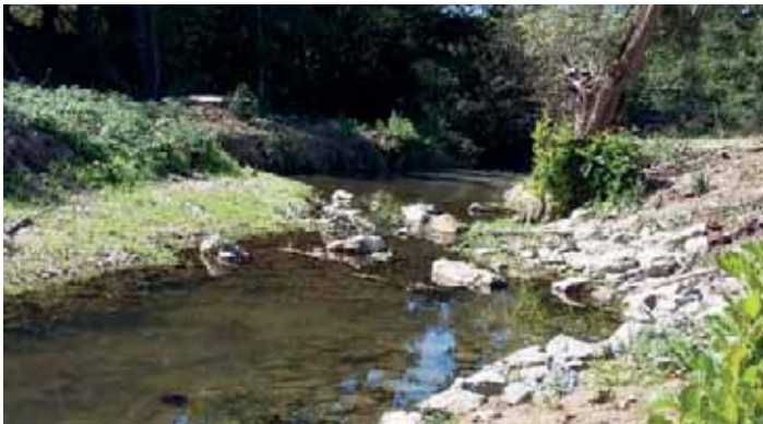
Un exemple de travaux réalisés : la renaturation du Ligneron

Le Syndicat Mixte des Marais, de la Vie, du Ligneron et du Jaunay a engagé en 2019 une étude bilan du Contrat Territorial 2015-2019 qu'il coordonne dans le cadre de la mise en œuvre du Schéma d'Aménagement et de Gestion des Eaux (SAGE) . Sur les cours d'eau et marais du bassin versant, les travaux suivants ont été réalisés :