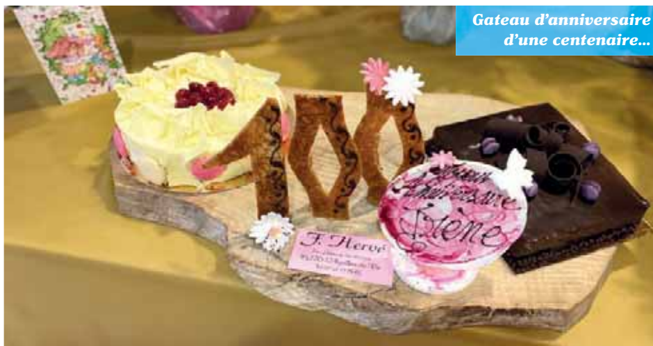
Gâteau d'anniversaire d'une centenaire...